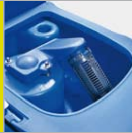
Leichter Zugang zum Schmutzwassertank

Diese neue SCRUBTEC Serie Mitgänger-Scheuersaugmaschinen ist der moderne, praktische Ansatz zu effizienter Bodenreinigung. Dank einer Politik des permanenten Dialogs mit den Kunden entwirft Nilfisk-ALTO Maschinen, die genau den Anforderungen der Anwender entsprechen. Nicht mehr, nicht weniger.