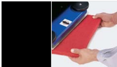
Leicht zu wechselnde Pads