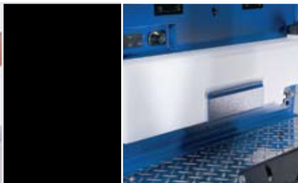
Optional für alle Modelle: Reinigungsmittel-Mischsystem