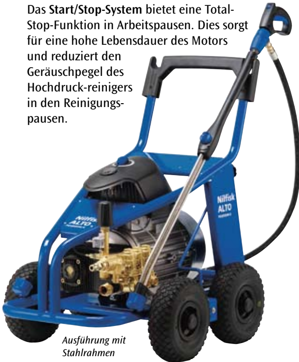
Ausführung mit Stahlrahmen

Das Start/Stop-System bietet eine Total-Stop-Funktion in Arbeitspausen. Dies sorgt für eine hohe Lebensdauer des Motors und reduziert den Geräuschpegel des Hochdruckreinigers in den Reinigungspausen.