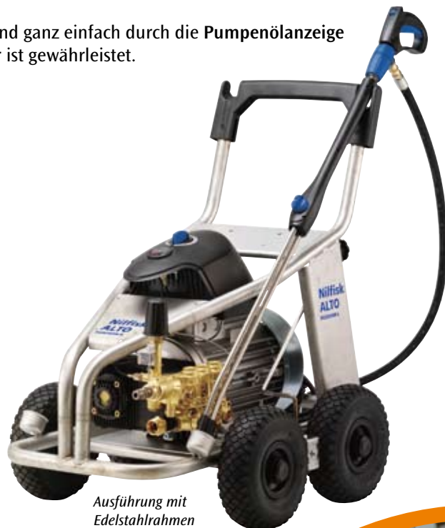
Ausführung mit Edelstahlrahmen