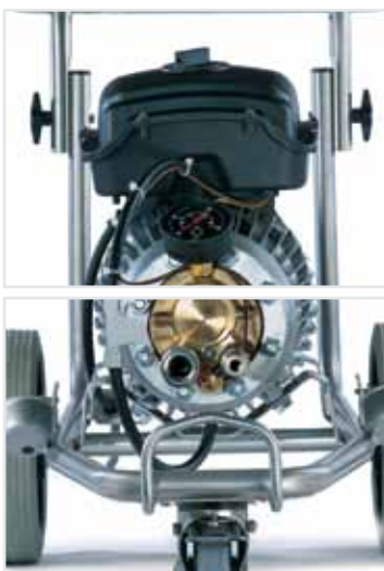
Das Herzstück des POSEIDON 7: C3 Pumpe mit vier Keramikkolben.