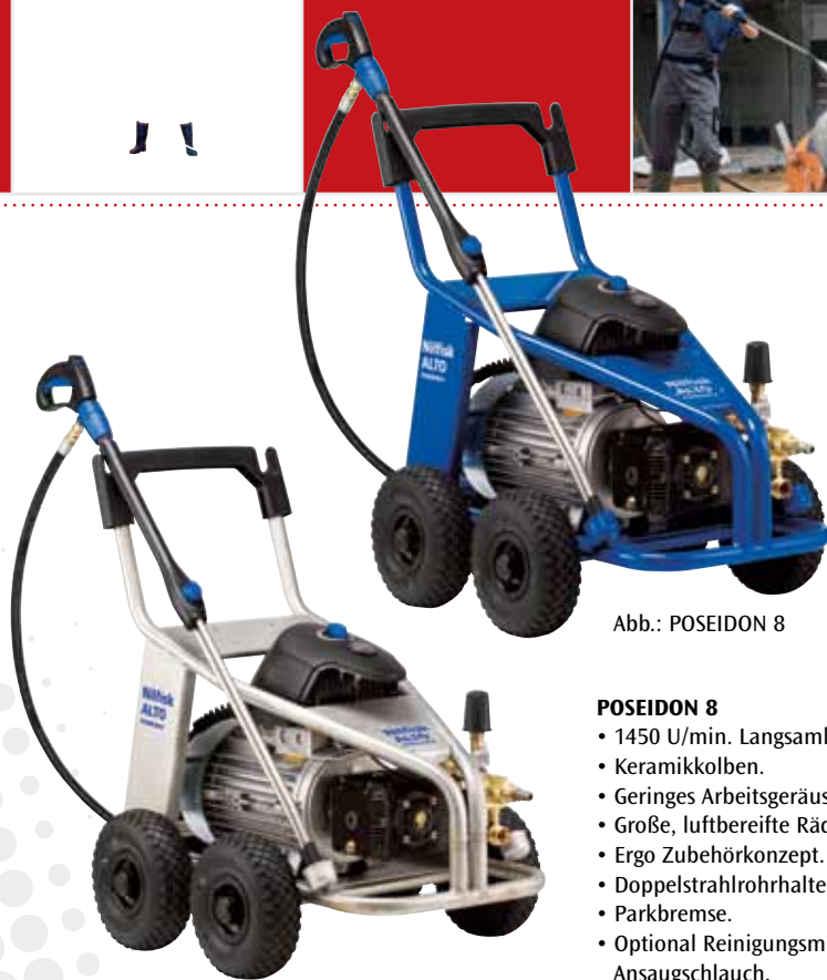
Abb.: POSEIDON 8