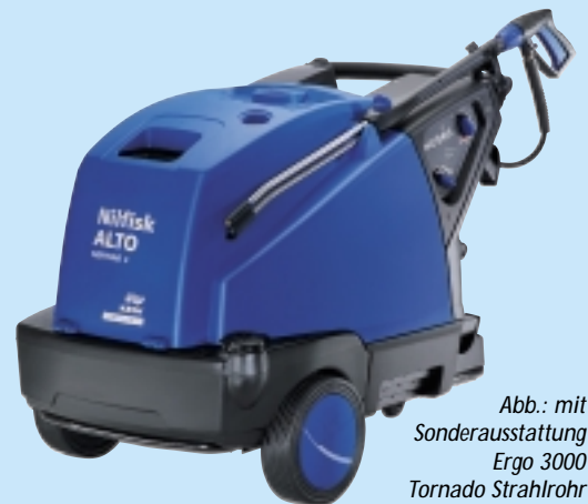
Abb.: mit Sonderausstattung Ergo 3000 Tornado Strahlrohr

Lieferumfang: Ergo 1000 Pistole, Ergo 3000 Universal-Strahlrohr, Tornado Plus Düse Art.-Nr. 301002474 2.190,00 EUR