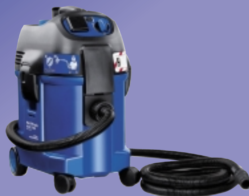
Abbildung: ATTIX 360-2H