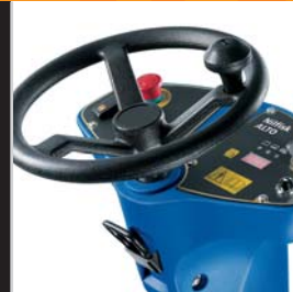
Ergonomisch verstellbares Lenkrad für optimalen Bedienkomfort